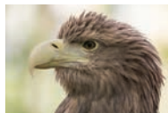
Ørna har stort nebb. Ørna spiser.