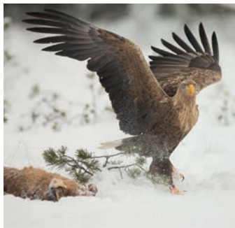
Ørna er et rovdyr. Rovdyr spiser andre dyr.