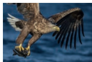
Ørna spiser fisk.