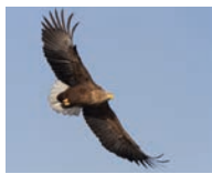
Ørna har store vinger. Ørna flyr.

Tekstenes oppbygning kan variere ut fra tekst til tekst, men gjennom boken møter elevene gjentatte ganger - overskrift (forteller hva teksten handler om) - illustrasjon eller bilde (støtter og bekrefter det leste) - tekst til bilde - øveord - hensikten med lesingen